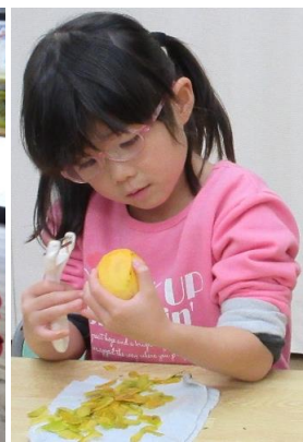
毎年恒例の干し柿作り！今年も5歳児が皮むきを頑張りました( ^o^ )