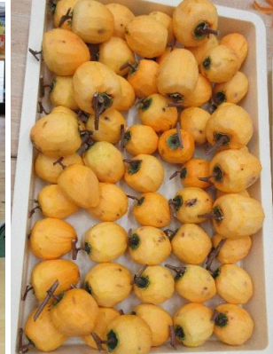
みんな真剣な表情で黙々と作業をし…あっという間に剥けました…(*▽*)