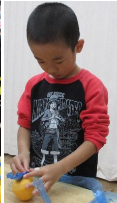
皮を剥いた柿にひもを付けていきます。「先生こう？」と何度も聞きながら一つ一つ丁寧に慎重に…