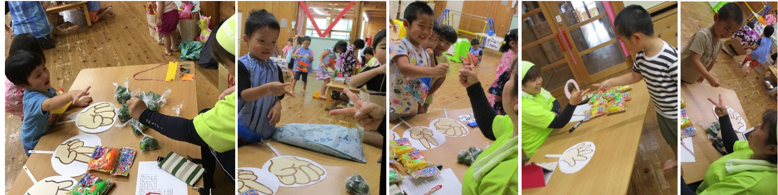
園長先生とじゃんけんをして、勝つと商品がもらえます。来年こそは、保護者の皆様と納涼祭を開催できるといいなあ…。