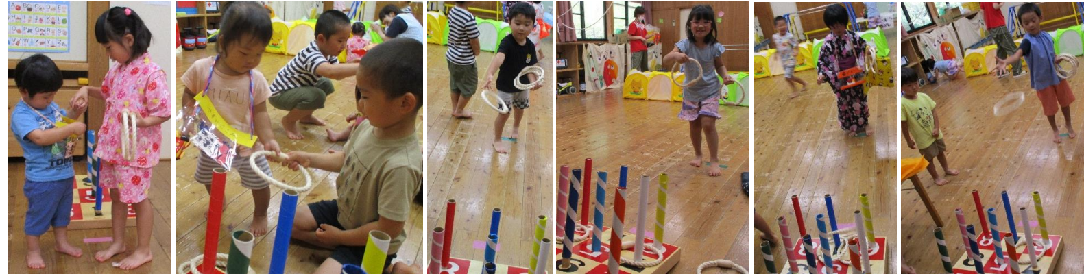
わなげは、年齢によって距離の長さを調整。4、5歳児のお友達は、狙いを定めて上手く投げていました。