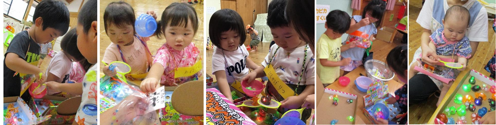
ぴかぴかすくいは、ジャンボ金魚にジャンボあひると森の虫たち。ピカピカ光るのを不思議そうに見ていました。