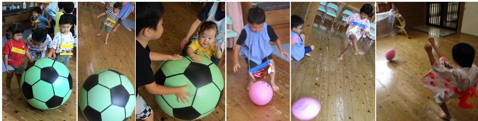
4、5歳児がお店屋さんです。千ヶツを渡すと挑戦できます。まずはサッカー！年齢によってボールの大きさが違います！