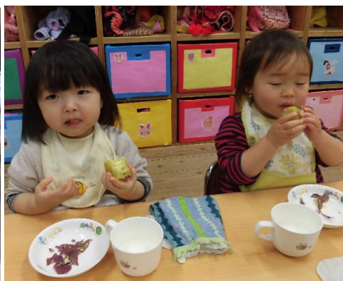
0、1歳児は、ふかし芋のおやつでした。自分で上手に皮をむいていましたよ。