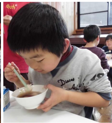
4、5歳児が作った鏡餅で… かがみ開きをしました。