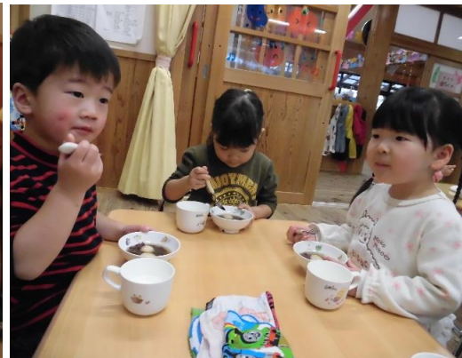
ぜんざいが、大好きな子！苦手な子…それぞれですが(*´艸`)残さずきれいに食べました。